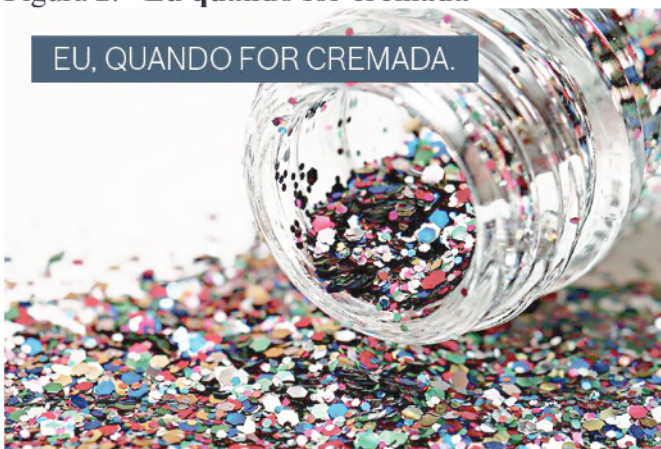
Figura 2. “Eu quando for cremada”